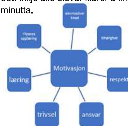
Denne modellen viser kva faktorar som har innverknad på motivasjonen.

Vi som jobbar i skulen kjenner oss igjen i at elevane sin motivasjon endrar seg etter kvart som dei blir eldre. Ved å ha fokus på elevmotivasjon, og særleg elevmedverknad, vil skulane kunne gjere ein innsats som bidrar til å betre elevane sin motivasjon til å lære.